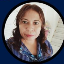
NOVI SESFAO ADMIN PRODI BDP

+62 813 3858 3580 https://bdp.undana.ac.id/ bdp.fpkp@undana.ac.id